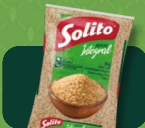
Arroz Solito Parboilizado Integral