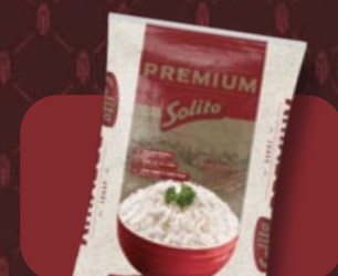
Arroz Solito Premium 5 kg