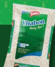
Arroz Vitabon Tipo 1