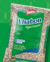
Feijão Vitabon Carioca