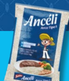
Arroz Ancéli Tipo 1