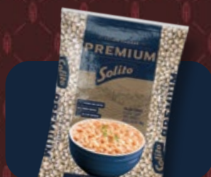
Feijão Solito Premium 2 kg