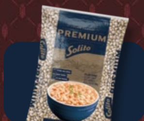
Feijão Solito Premium 1 kg