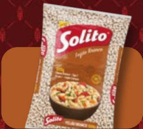
Feijão Solito Branco