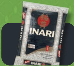
Arroz Solito Oriental Inari