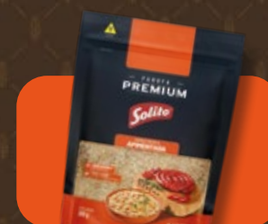
Farofa Pronta Solito Premium Apimentada