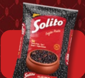
Feijão Solito Preto