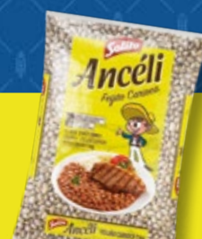
Feijão Carioca Ancéli