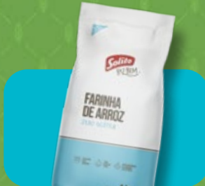
Farinha de Arroz Solito Faz Bem