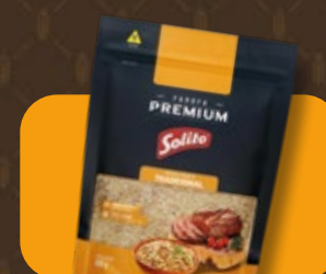
Farofa Pronta Solito Premium Tradicional