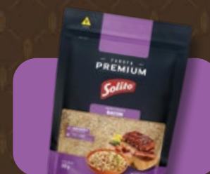
Farofa Pronta Solito Premium Bacon