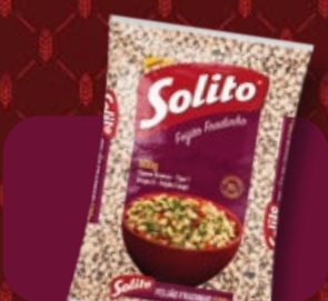
Feijão Solito Fradinho