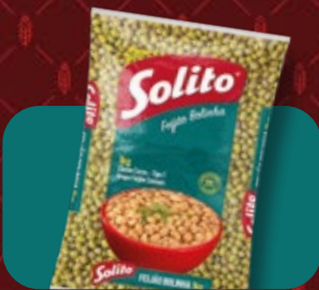
Feijão Solito Bolinha